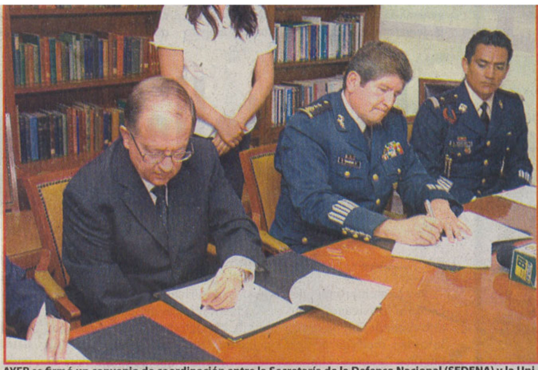
AYER se firmó un convenio de coordinación entre la Secretaría de la Defensa Nacional (SEDENA) y la Universidad Autónoma de Aguascalientes (UAA), con objeto de construir un Asta Bandera Monumental de 50 metros de altura en el campus universitario a cargo de la SEDENA.