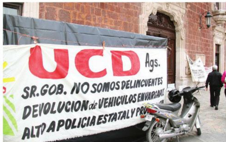
Manifiestantes seguirán al pie del cañón