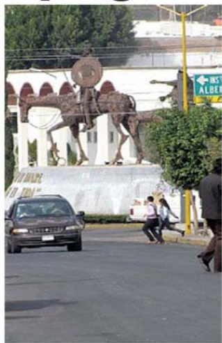
REUBICACION La glorieta del Quijote desaparecerá a la brevedad y sus esculturas serán recolocadas metros arriba.

MEXICO, D.F.- En un encuentro donde el secretario de Salud reconoció las acciones preventivas que aplica el sector en Aguascalientes para garantizar el bienestar de los habitantes, el gobernador Carlos Lozano agradeció la voluntad política del funcionario federal para sacar adelante los pendientes y los planes para la Entidad. Asimismo, reconoció la disposición del secretario de Salud para resolver los problemas que prevalecen en la aplicación de soluciones para reforzar los bienes muebles e inmuebles para la atención integral de los aguascalentenses.