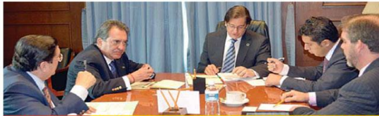
ANALISIS En el Distrito Federal se reunieron el gobernador de Aguascalientes y el secretario de Salud, con colaboradores, para revisar avances de los distintos programas que en ese campo tienen lugar en esta Entidad.